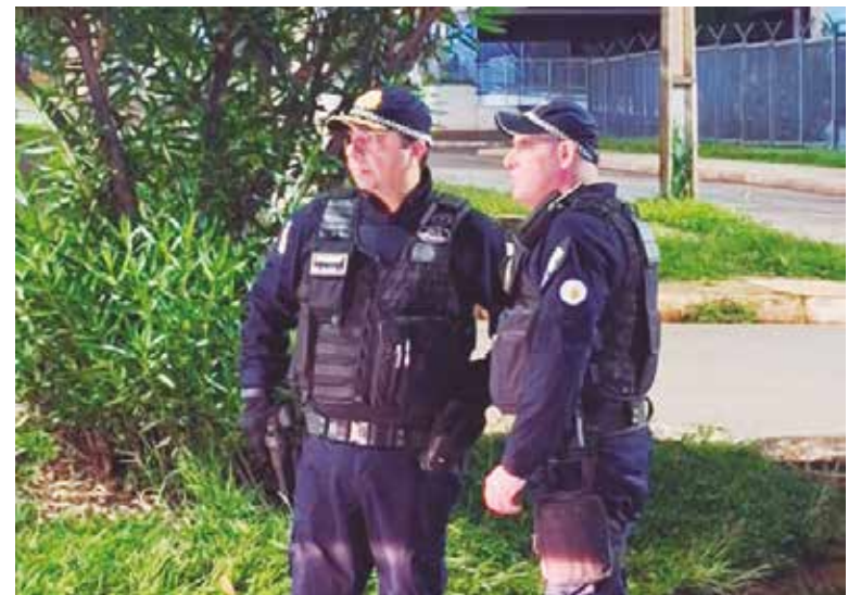
O novo comandante já está em ação nas ruas, coordenando as operações in loco

Além disso, o reforço no efetivo e a chegada de novas viaturas vão fortalecer o policiamento. Até o final