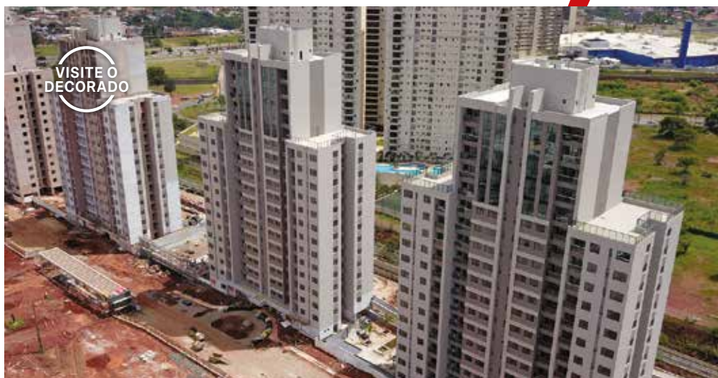
3º Ofício R07 145070