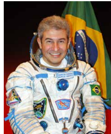
Realizada em 2006, a Missão Centenário levou Marcos Pontes à Estação Espacial Internacional a bordo da nave russa Soyuz TMA-8, tornando-o o primeiro brasileiro no espaço

Com acesso gratuito, a exposição reforça o Manhattan Shopping como um espaço de experiências acessíveis e relevantes para a comunidade, ampliando seu papel como ponto de encontro para lazer, aprendizado e convivência em Águas Claras.